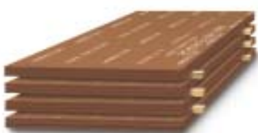
Chapa antidesgaste HARDOX de nuestros stocks...

Somos especialistas que podemos producir piezas de acero antidesgaste HARDOX y reducir sus periodos improductivos. Continuamente impartimos cursos de formación a nuestro personal para garantizar alta calidad y fiabilidad en nuestros productos. Seguimos desarrollando sistemas técnicos, métodos y procesos en un intenso intercambio de experiencia con nuestros clientes. Y como un recurso y seguridad adicional contamos con “ingenieros de HARDOX” en SSAB Oxelösund.