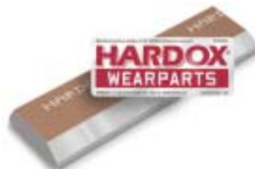
...se convierte en repuestos antidesgaste HARDOX Wearparts, provistos de la etiqueta oficial.