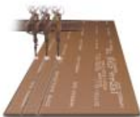
...transformada en piezas...